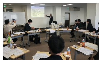
講義・討論・対話・面談